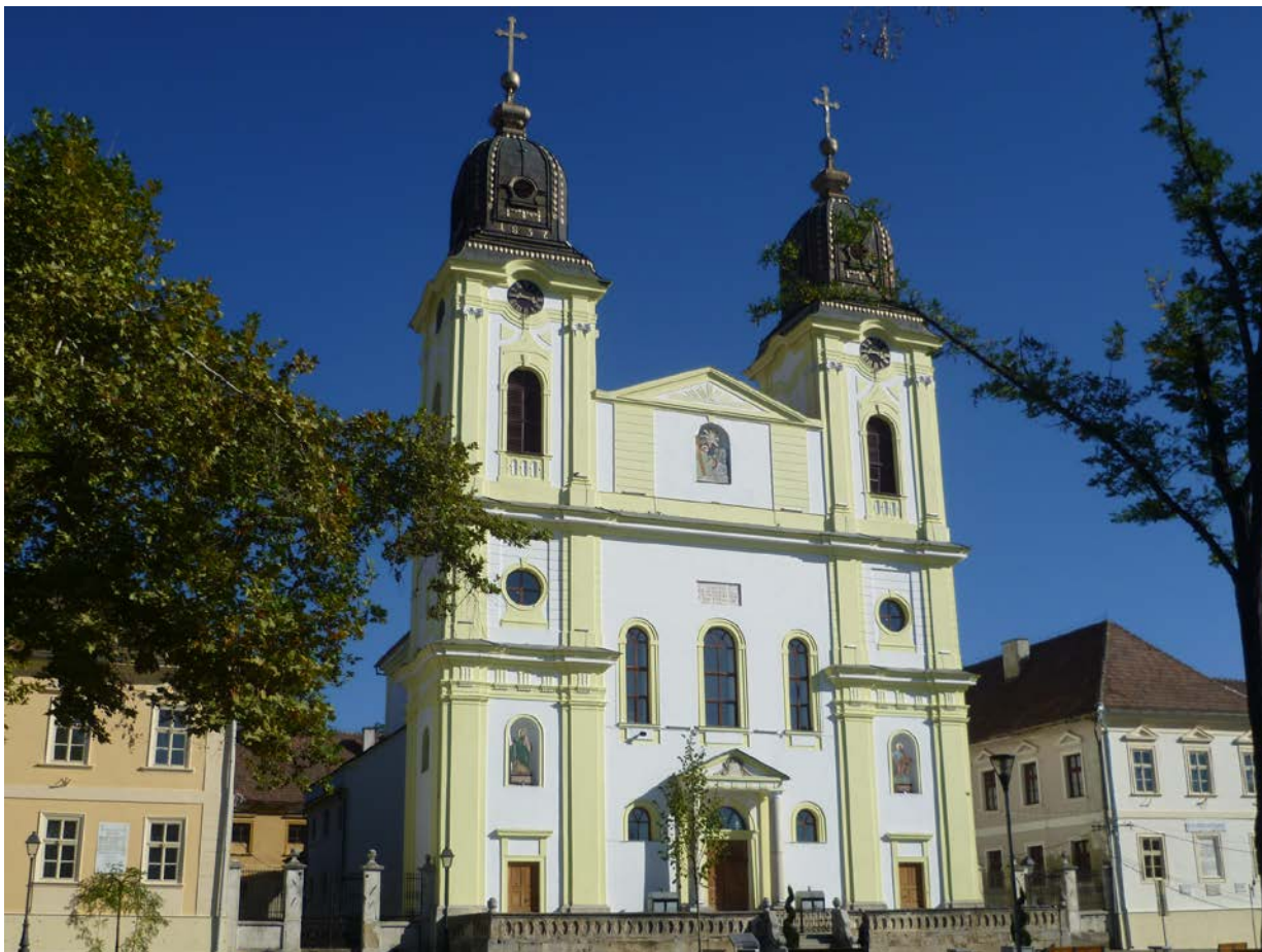
Fig. 4. Catedrala arhiepiscopală greco-catolică „Sfânta Treime” din Blaj

Timotei Cipariu etc. Marea adunare națională de la Blaj fixează programul social-politic al revoluției din Transilvania, ideea centrală a programului acestei adunări fiind „Națiunea română se declară și se proclamă ca națiune de sine stătătoare...”. Ansamblul statuar Câmpia Libertății cuprinde un monument și busturile a 24 de personalități ale istoriei și culturii românești din sec.19. Ansamblul a fost inaugurat în anul 1973, cu prilejul împlinirii a 125 de ani de la Revoluția din 1848.