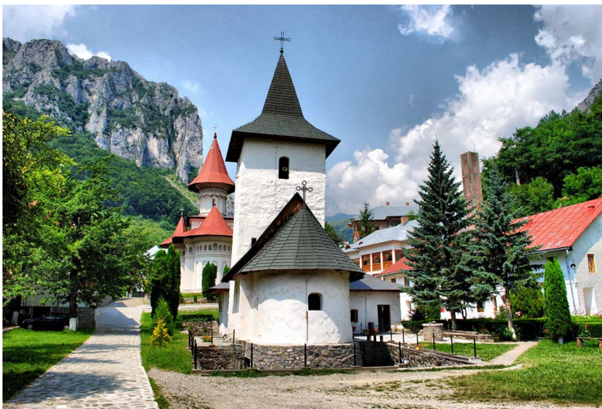
Fig 2. Mănăstirea Râmeț

Mănăstirea Râmeț este așezată la ieșirea văii Mănăstirii (numită mai spre aval valea Geoagiului) dintr-un sector de chei, ale căror versanți foarte spectaculoși sunt ușor de observat chiar din curtea mănăstirii. După cum indică o inscripție din anul 1377, aflată în biserica veche pe cel de-al doilea strat de pictură din cele șapte straturi existente, mănăstirea este mai veche, cel puțin din sec.13 sau chiar din sec.12, fapt care arată că este vorba despre unul din cele mai vechi lăcașuri ortodoxe din Transilvania. În imediata vecinătate a bisericii vechi se află muzeul mănăstirii, iar puțin mai sus, între anii 1982-1986 a fost construită biserica nouă. Tot în incinta mănăstirii se găsesc atelierelor unde maicile țes renumitele lor covoare.