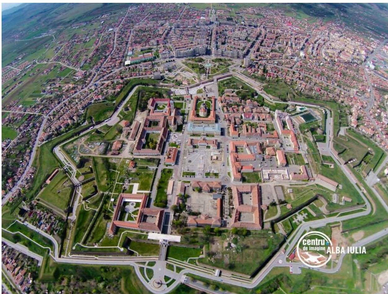
Fig. 3. Cetatea Alba Iulia

Cetatea Alba Carolina a fost construită între anii 1715-1738, în timpul împăratului Carol al VI-lea, după un plan al arhitectului italian Giovanni Morando Visconti. Ea reprezintă o fortăreață cu bastioane, de tip Vauban (în formă de stea), având ca rol principal pe cel de apărare a Imperiului Habsburgic împotriva amenințărilor militare ale Imperiului Otoman. Cetatea, ce se întinde pe o suprafață de peste 100 ha, reprezintă cea mai extinsă și mai bine conservată cetate de tip Vauban din Europa și cel mai frumos exemplu de obiectiv istoric restaurat recent din România. Acest lucru este dovedit și de certificatul de excelență primit în anul 2015 din partea TripAdvisor, cel mai mare site de recomandări turistice interactive din lume. Cetatea include mai multe categorii de obiective: ziduri, bastioane, porți, edificii religioase și laice, statui.